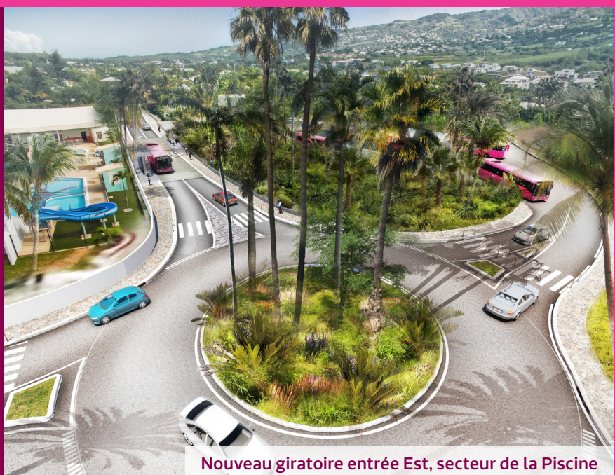
Nouveau giratoire entrée Est, secteur de la Piscine

Des aménagements en faveur des bus, de l'intermodalité, de l'espace public et de la sécurisation des déplacements