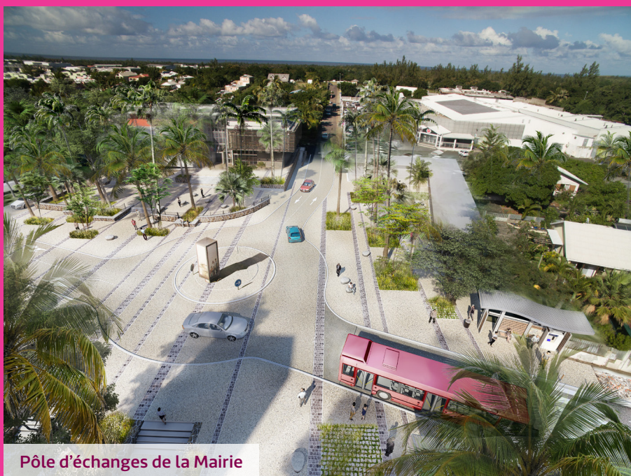
Pôle d'échanges de la Mairie

Des aménagements en faveur des bus, de l'intermodalité, de l'espace public et de la sécurisation des déplacements